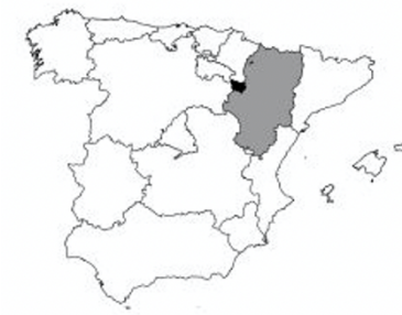
Mapa de localización de rutas de BTT de Almazaras del Moncayo en la comarca